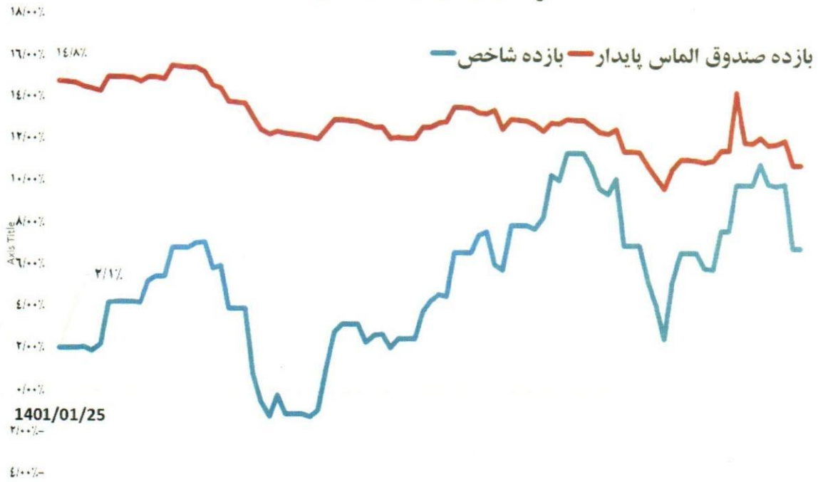
مقایسه بازده صندوق گنجینه الماس پایدار با شاخص کل بورس از ۱۴۰۱/۰۱/۰۱ تا ۱۴۰۱/۰۳/۳۱

۷- مقایسه بازده صندوق (با فرض عدم پرداخت سود ماهانه) با بازده شاخص کل بورس (عدم پرداخت سود).